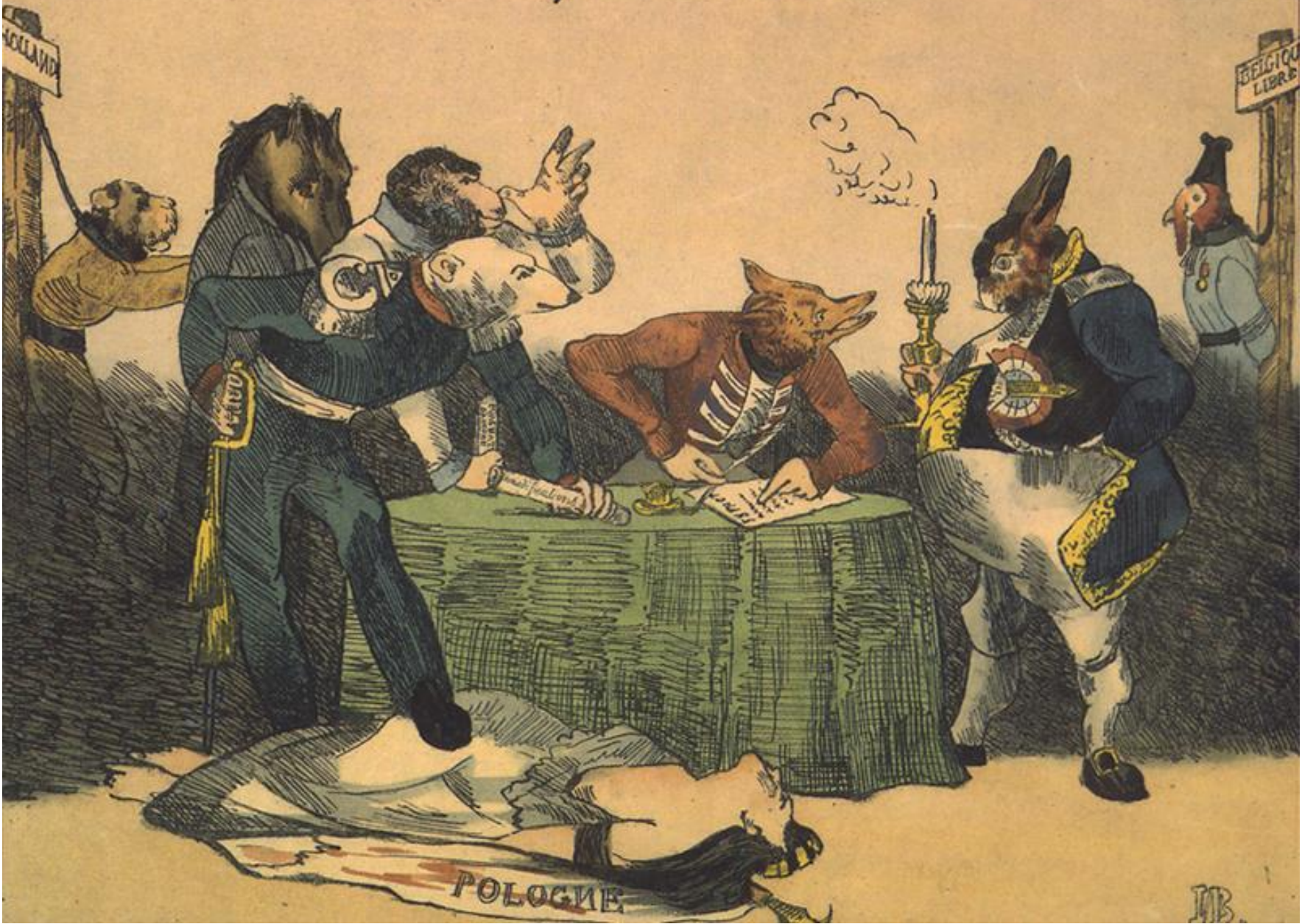
Konferencija u Londonu iz 1832.