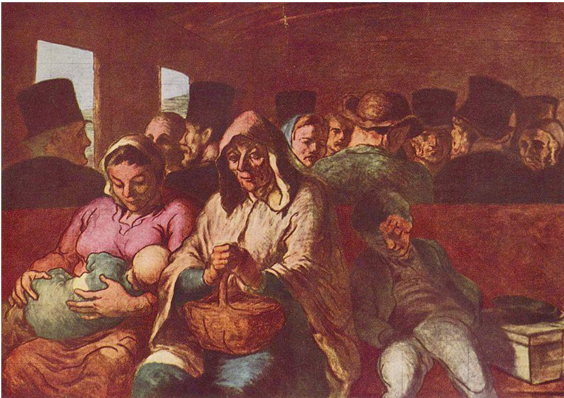
Uhvatio je tipično moderno ljudsko stanje: "usamljenu gomilu"