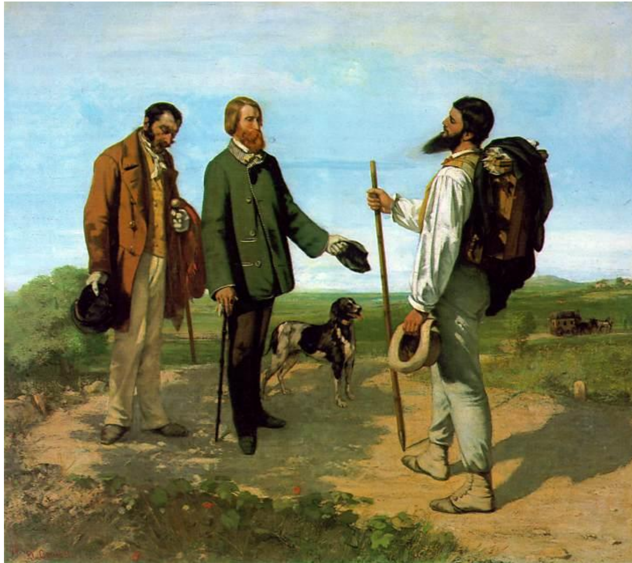
Dobar dan gospodine Kurbe, (Bonjour, Monsieur Courbet), 1854

Drugo njegovo delo, Dobar dan gospodine Kurbe , iako kritika klasnih odnosa društva njegovog doba , je međutim izloženo na istoj izložbi.