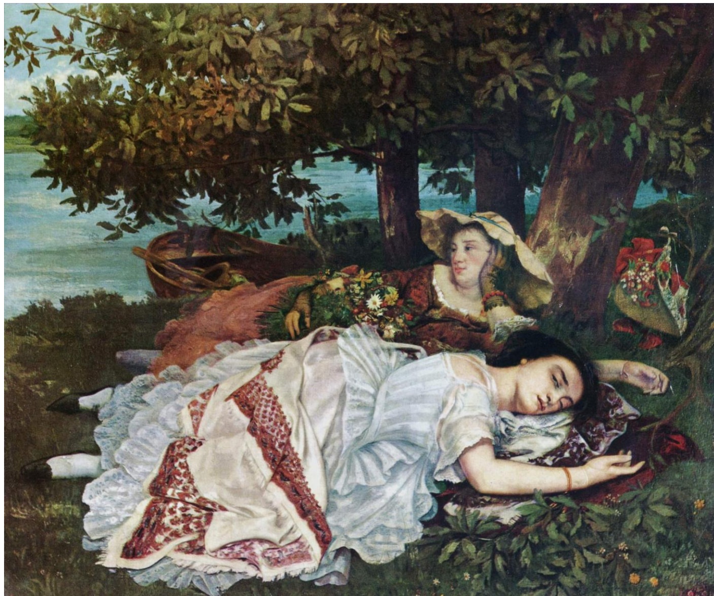
Gustave Courbet, Gospođice na obali Sene, 1856