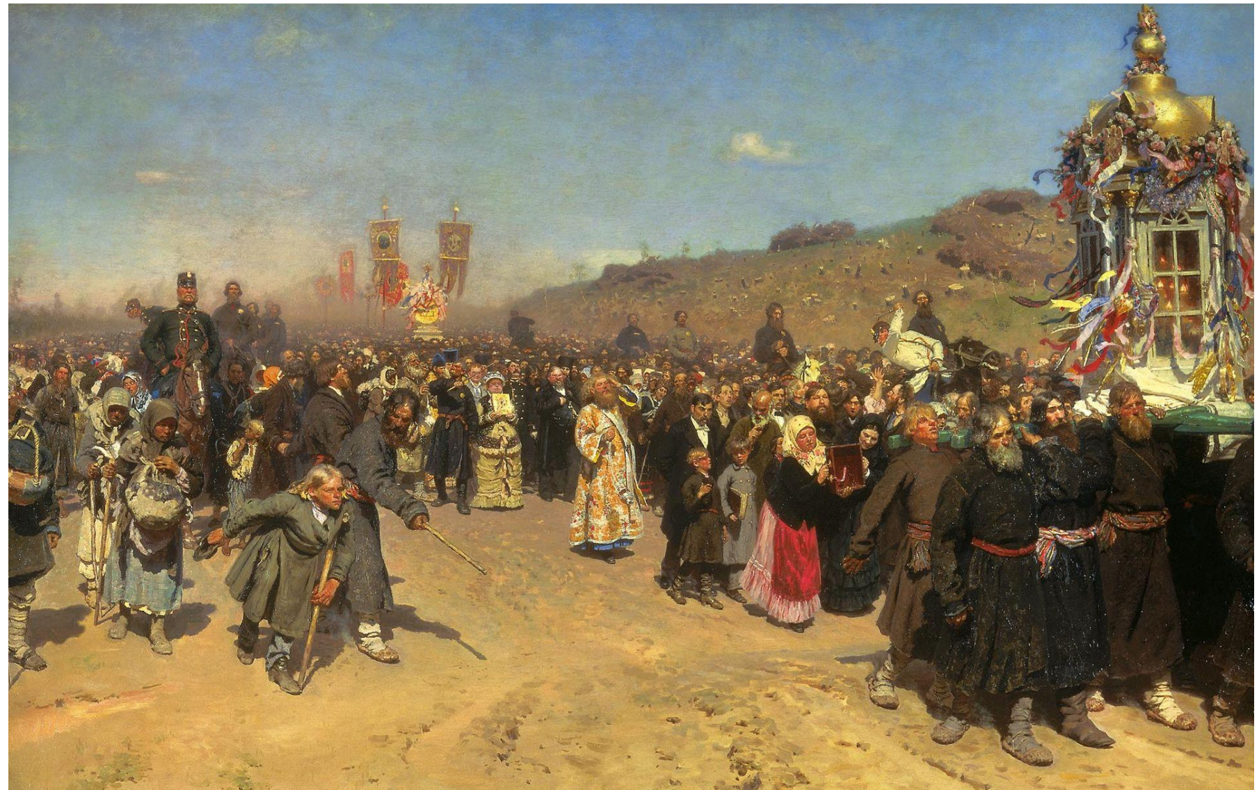
Uskršnja procesija u Kurskoj guberniji (1880 — 1883 )

Svi na slici su ujedinjeni u laganom, ali neprekidnom kretanju napred.