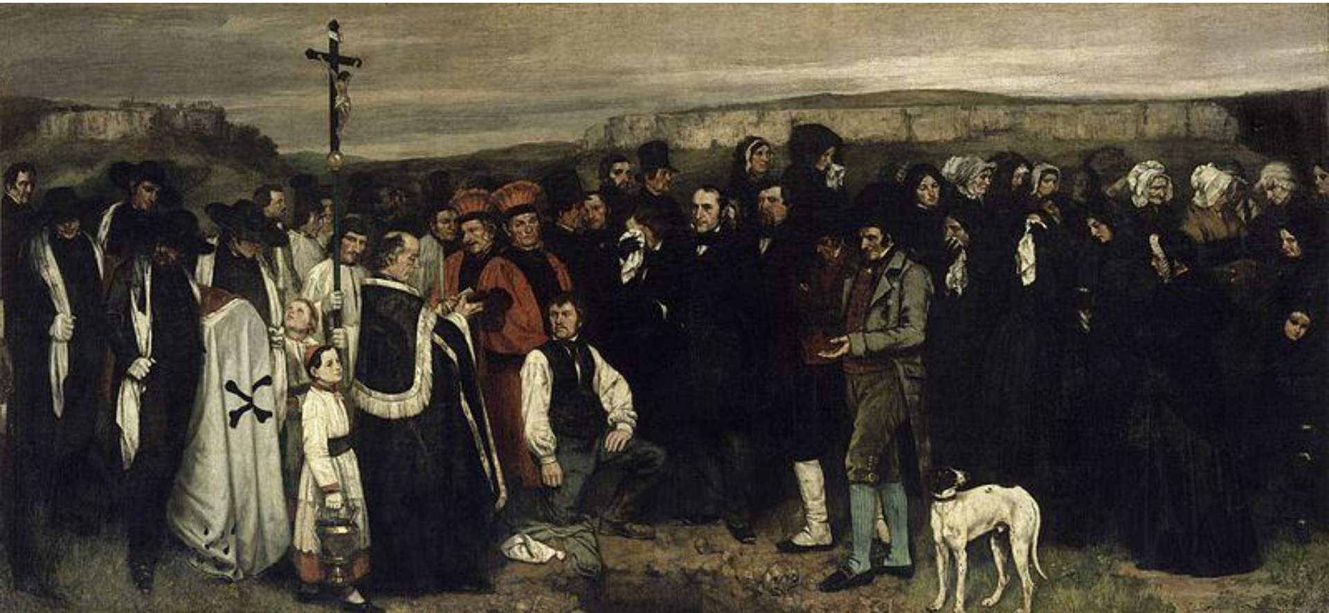
Kurbe, Sahrana u Ornanu, 1849, 315x668 cm

Reakcije su burne: « Da li je moguće slikati ovako ružne ljude? » «Ružno u prirodnoj veličini! ».