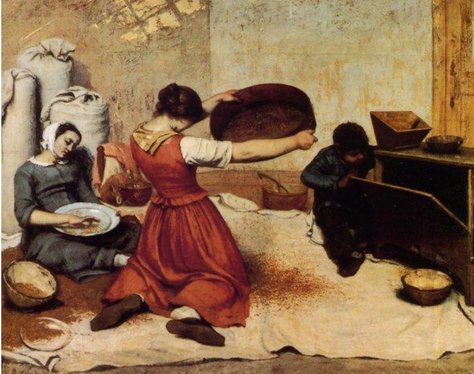
Kurbe, Prosejavanje žita, 1854