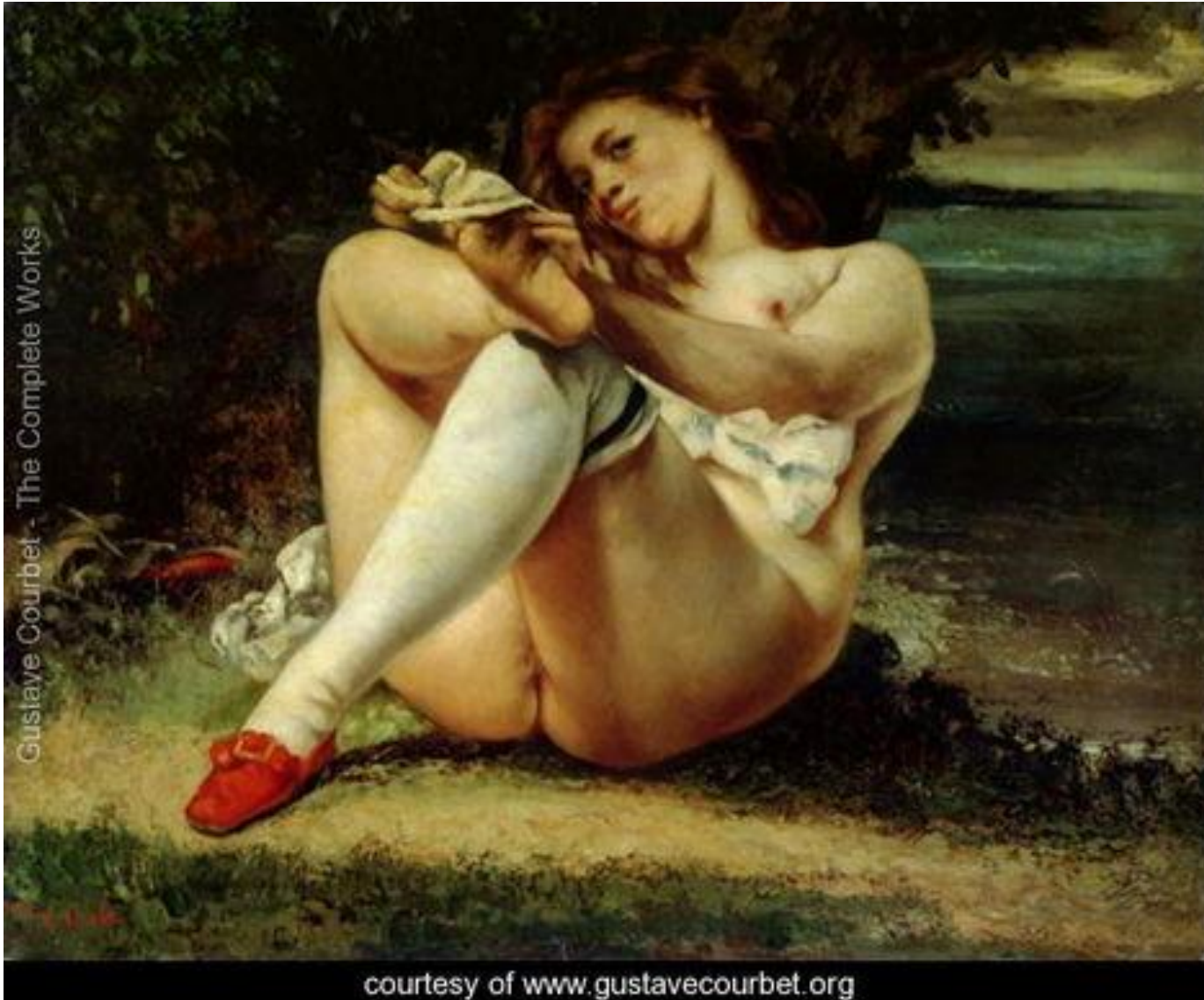
Gustave Courbet, Žena sa belim čarapama, oko 1861