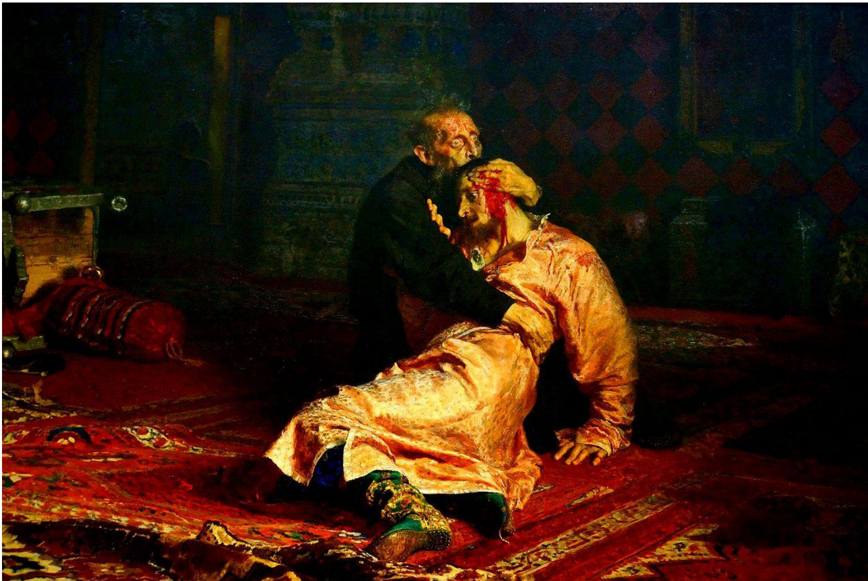
Ivan Grozni i njegov sin

Slika pokazuje užasnutog Ivana Groznog, koji grli svoga sina, koji umire, a koga je on pre toga smrtno ranio u nekontrolisanom besu.