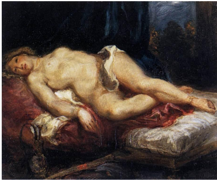
Delacroix, Odalisque, 1827-28