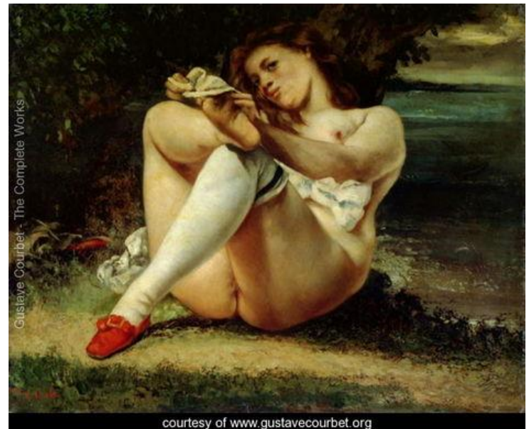
Gustave Courbet, 1866