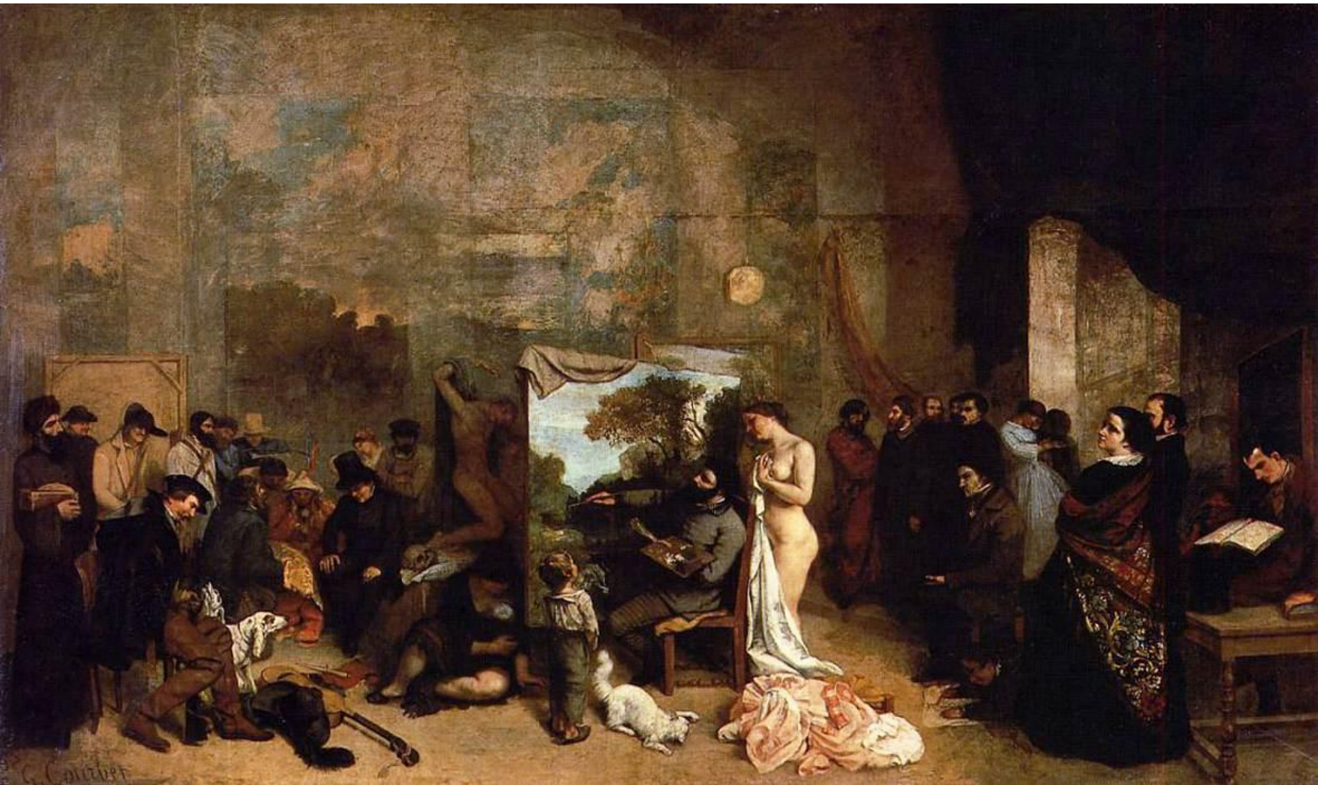
Kurbe, Unutrašnjost mog ateljea : 1854-1855, 352x587 cm

Kada mu i sledeće delo, okarakterisano kao «vulgarno», biva odbijeno na Svetskoj izložbi 1855, Kurbe sam organizuje svoju sopstvenu izložbu u prostoru koji će nazvati « Paviljon Realizma ».