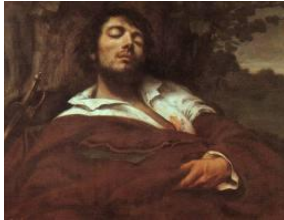
Autoportret (ranjenik), 1844-45