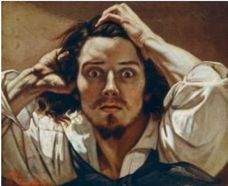
Autoportret (očajnik), 1843-45

Od 1849 će formulirati ime i program za novi pravac, realizam.